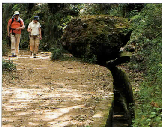
Un magnifique exemple de Levada : un canal d'irrigation, apanage de l'agriculture locale, dont le réseau total s'étend sur 1 600 km. Un système copié sur l'Espagne arabo-andalouse.

tion pilotée par deux carreiros tout de blanc vêtus et coiffés d'un canotier, légers frissons garantis... Sur la route de Camacha, vous trouverez le Jardin Botanique, une visite incontournable car tellement instructive, s'agissant de la biodiversité madérienne. Une bonne introduction avant de se lancer sur les routes et les pistes de l'île que nous diviserons en trois parties. A l'ouest de l'île, de superbes villages sont suspendus sur des falaises qui plongent à pic dans l'Atlantique et de petits ports de pêches sont littéralement nichés sur le littoral. Tel Câmara do Lobos, non loin de Cabo Girao, un promontoire qui s'élève à 580 m au-dessus de l'océan. Ensuite, la station balnéaire de Ribeira Brava possède un musée ethnographique qui présente la vie quotidienne à Madère au fil des siècles. Tandis que plus à l'ouest, Ponta do Sol est réputé pour son ensoleillement et Ponta do Pargo pour ses horizons maritimes à perte de vue ! A Porto Moniz, des baignoires naturelles permettent une thalassothérapie offerte gracieusement par « Dame Nature ». Puis entre Sao Vicente et Ribeira Brava, la route 104 qui traverse Madère du nord au sud permet d'accéder à des visites guidées de grottes : les Grutas de Sao Vicente. Ultérieurement, l'on parvient à un somptueux belvédère, celui de la Boca da Encumeada. Le centre de Madère fournit pour sa part de