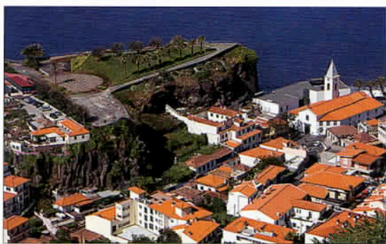
Une vue de Camara de Lobos, dont la plage a été rendue célèbre par Winston Churchill qui y installa son chevalet en 1949.

plupart du temps d'explications en français. Après, l'un des temps forts à Funchal est assurément la spectaculaire ascension en téléphérique qui relie la vieille ville au village de Monte à 600 m d'altitude. Afin d'y admirer la splendide église Nossa Senhora do Monte à proximité de laquelle sont plantés deux beaux jardins : le jardin do Monte et jardin tropical Monte Palace. La redescente vers Funchal pouvant s'opérer sur un Carro do cesto, un traîneau de rotin glissant sur l'asphalte. Une embarca-