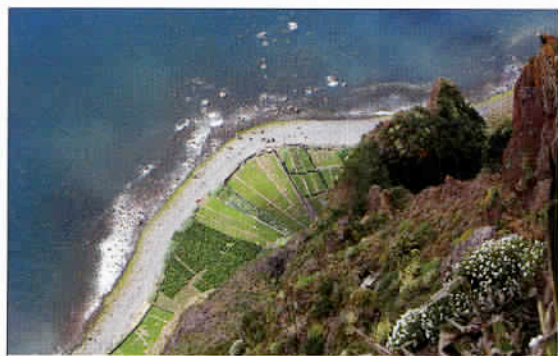
Une vue en plongée vertigineuse au sommet du Cabo Girao, le deuxième plus haut promontoire d'Europe, puisqu'il s'élève à 580 m.